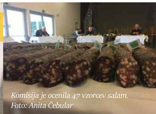
Komisija je ocenila 47 vzorcev salam.