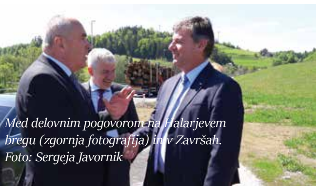
Med delovnim pogovorom na Halarjevem bregu (zgornja fotografija) in v Završah.

Aktivnosti bomo letos v septembru združili z Evropskim tednom športa, ki bo v Sloveniji potekal od 23. do 30. septembra. K aktivnemu sodelovanju vabimo vse ustanove, društva, klube, podjetnike in posameznike v občini Šmarje pri Jelšah. Dobrodošli so tudi vaši predlogi in ideje, kako dva tedna v septembru čim bolj zdravo mobilno in športno popestriti. (Sf)