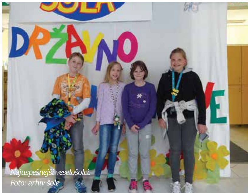
Najuspešnejši veselošolci.