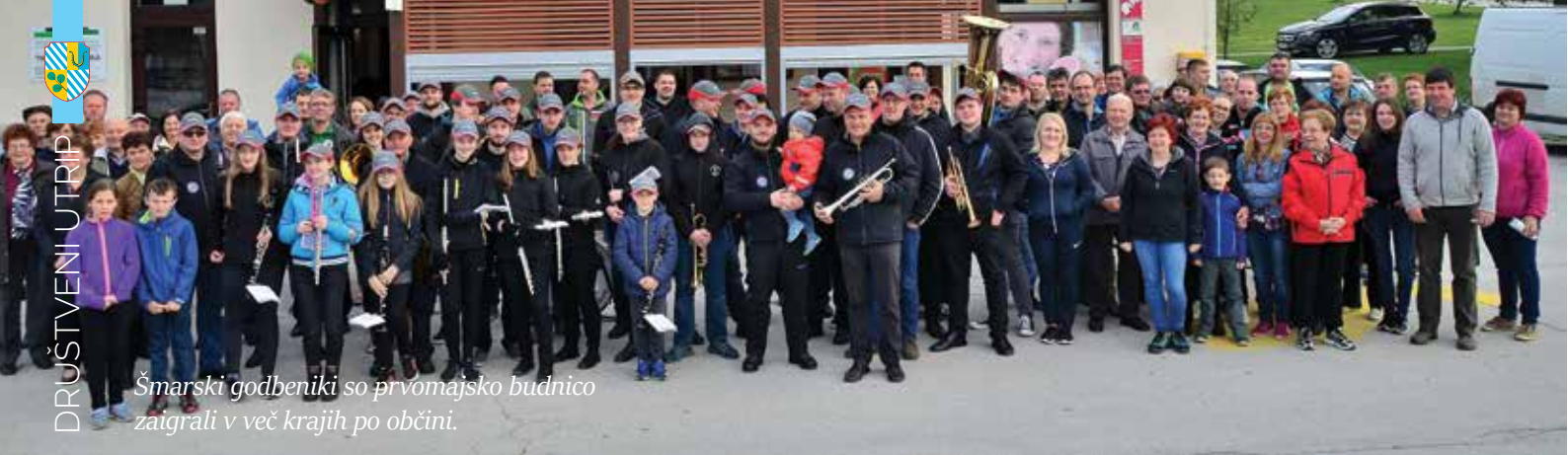
Šmarski godbeniki so prvomajsko budnico zaigrali v več krajih po občini.