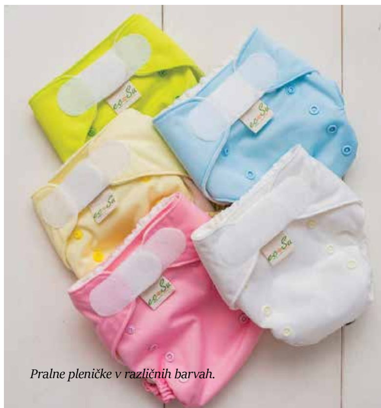
Pralne pleničke v različnih barvah.

»Po mojem mnenju slabosti ni. Veliko staršev se ustraši pranja in vzdrževanja plenit, ampak ko začnejo enkrat uporabljati pralne plenice, poročajo, da porabijo zelo