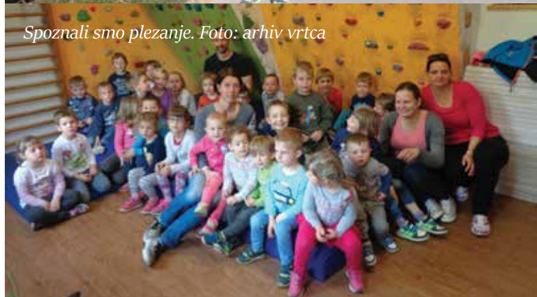
Spoznali smo plezanje.