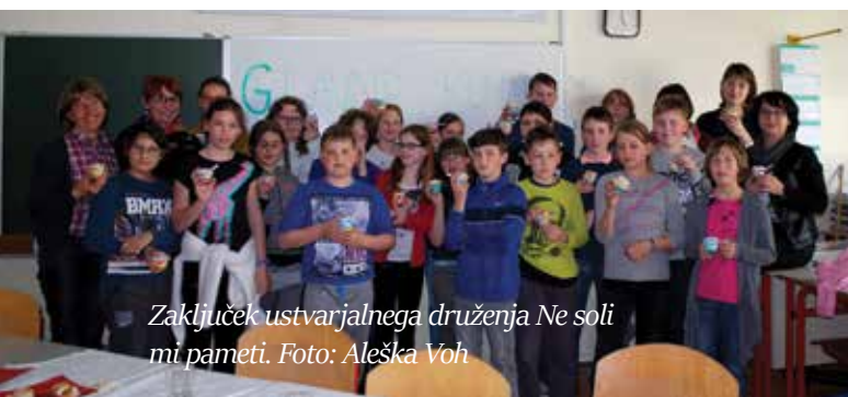
Zaključek ustvarjalnega društva Ne soli mi pameti.