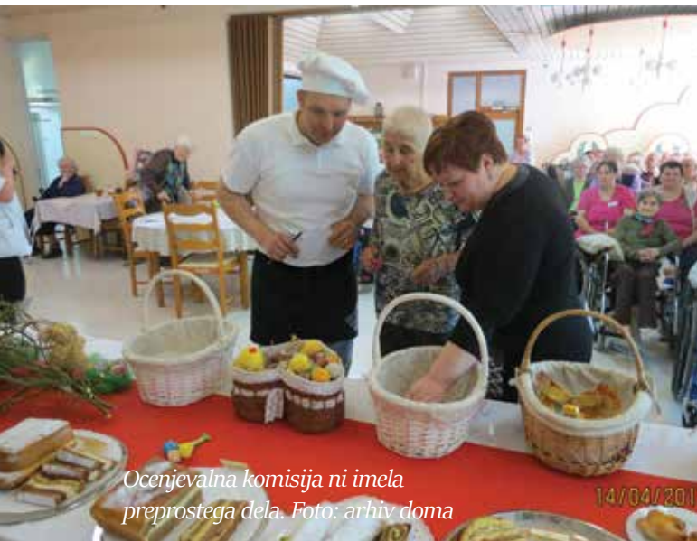
Ocenjevalna komisija ni imela preprostega dela.

Eva in Vita sta zadovoljni s prvim skupnim projektom, ki po njunih besedah ne bo zadnji. Videospot, ki ga je posnel Damjan Regoršek , si lahko pogledate na kanalu Youtube. (SJ)