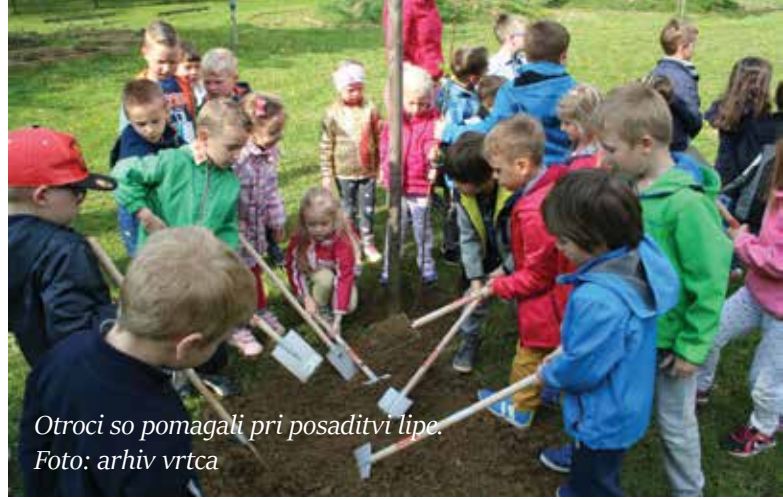
Otroci so pomagali pri posaditvi lipe.

Letos je našemu vrtcu, kot tudi vsem drugim osnovnim šolam in vrtcem, Čebelarstva zveza Slovenije v sodelovanju z Zavodom za gozdove podarila sadike lipe