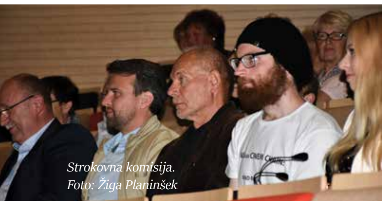
Strokovna komisija.