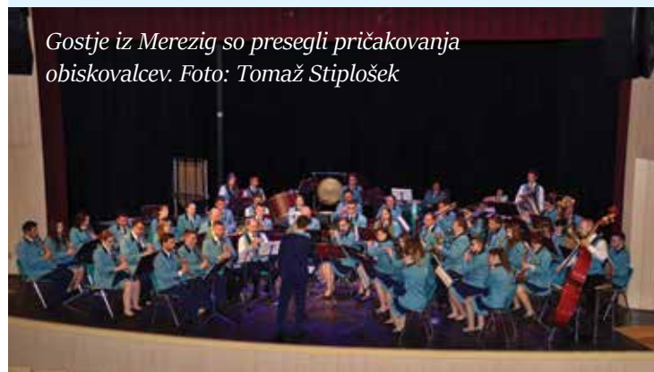
Gostje iz Marezig so preseglili pričakovanja obiskovalcev.