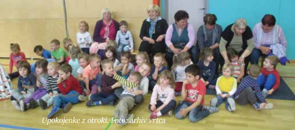
Upokojenke z otroki.