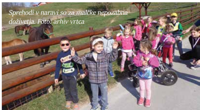
Sprehodi v naravi so za malčke nepozabna doživetja.