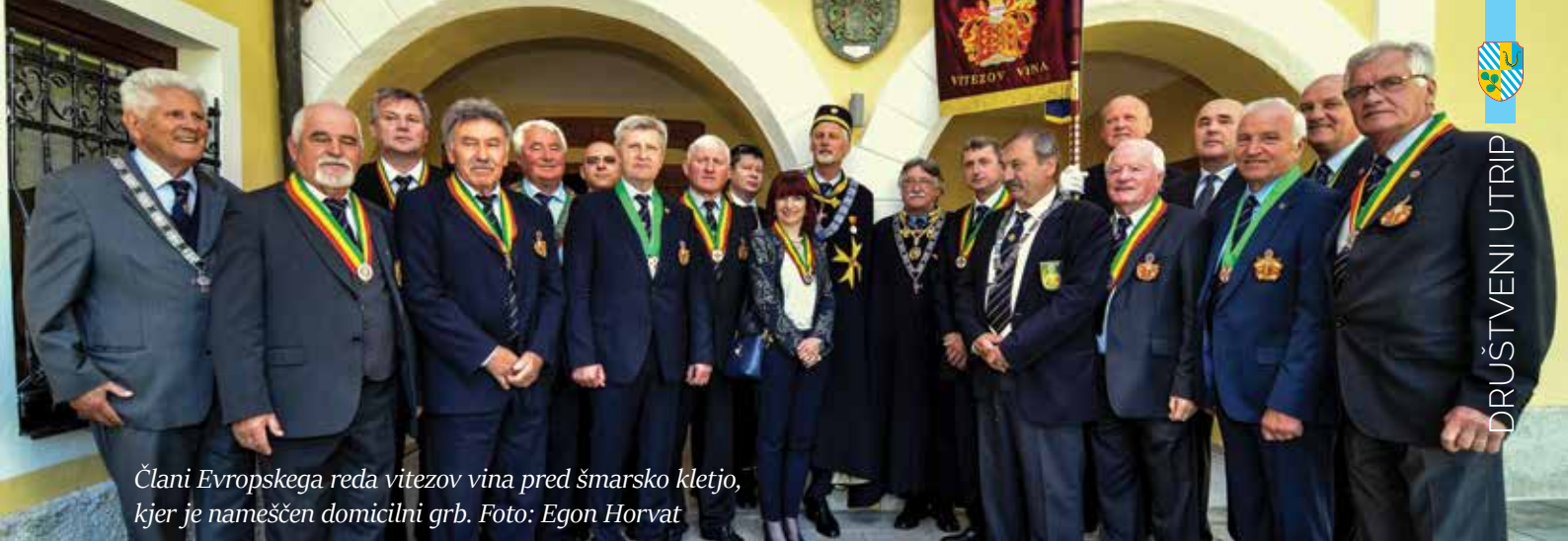
Člani Evropskega reda vitezov vina pred šmarsko kletjo, kjer je nameščen domicilni grb.