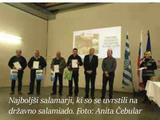
Najboljši salamarji, ki so se uvrstili na državno salamiado.