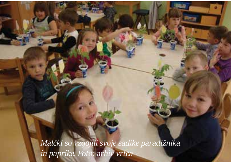
Malčki so vzgojili svoje sadike paradižnika in paprike.