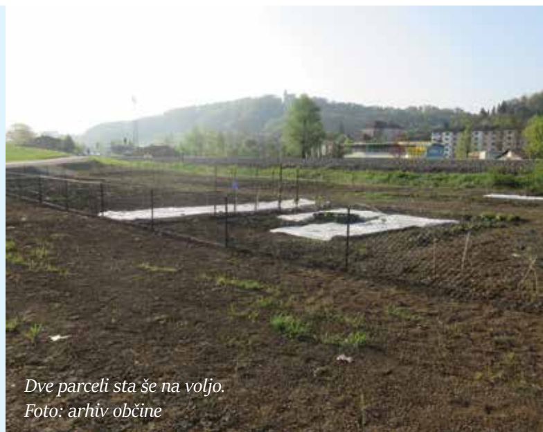
Dve parceli sta še na voljo.