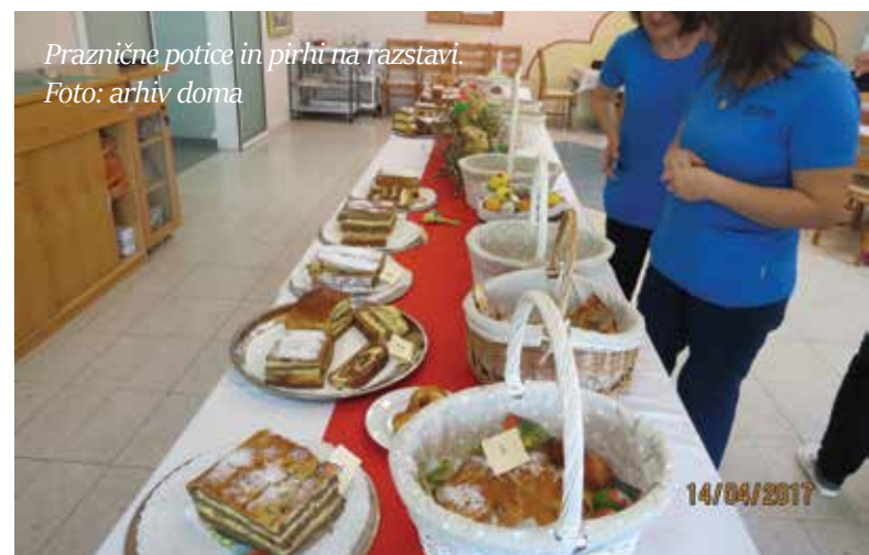
Praznične potice in pirhi na razstavi.

Gospodinje so se odločile speči različne vrste potic, kot so potratna, orehova, makova, rožičeva, niti mlinčevka, ki prihaja s Kozjanskega, ni manjkala na razstavnici mizi.