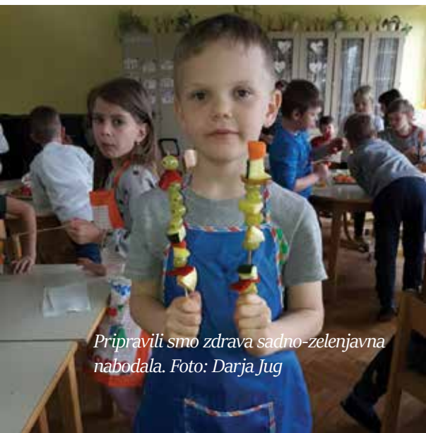
Pripravili smo zdrava sadno-zelenjavna nabodala.