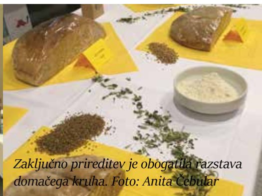
Zaključno prireditev je obogatila razstava domačega kruha.